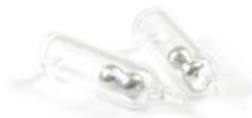
Snack Baits L rigaus