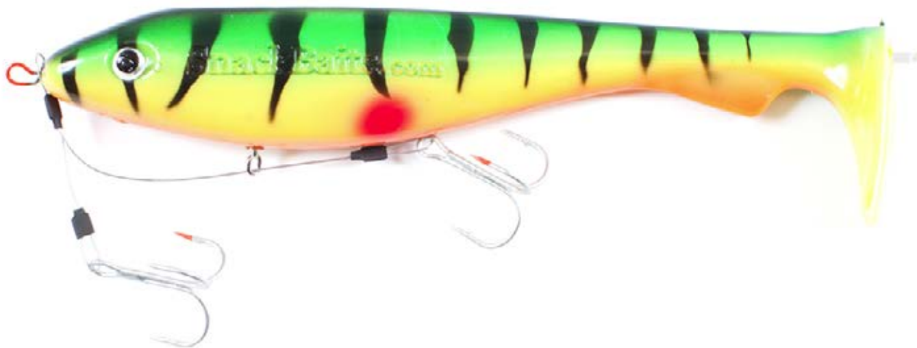
Snack Baits Jigiruuvi